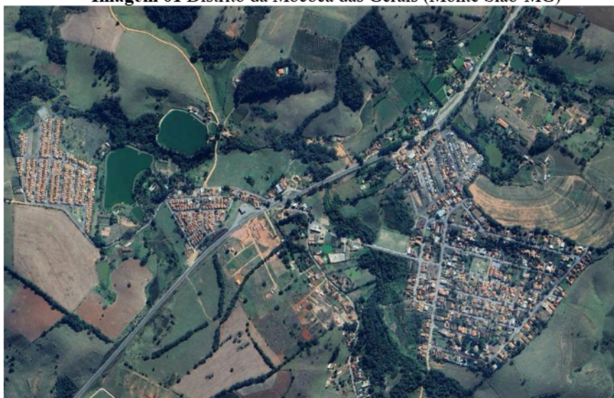
Imagem 01 Distrito da Mococa das Gerais (Monte Siao-MG)

Temos que a área territorial de Monte Siao–MG, é de aproximadamente 291,594 km 2 , conforme indica o Instituto Brasileiro de Geografia e Estatística (IBGE), dessa metragem, cerca de 10,79 km 2 fazem parte do perímetro urbano, logo, a extensão rural chega a aproximadamente 280,8 km 2 segundo os dados levantados nos arquivos desta prefeitura. Como também temos um levantamento de 2013, que indica que as estradas vicinais do município possuem cerca de 298,36 quilômetros lineares, dando uma dimensão da primordialidade não só desta, mas também de demais contratações relacionadas às locomoções e prestações de serviço em geral.