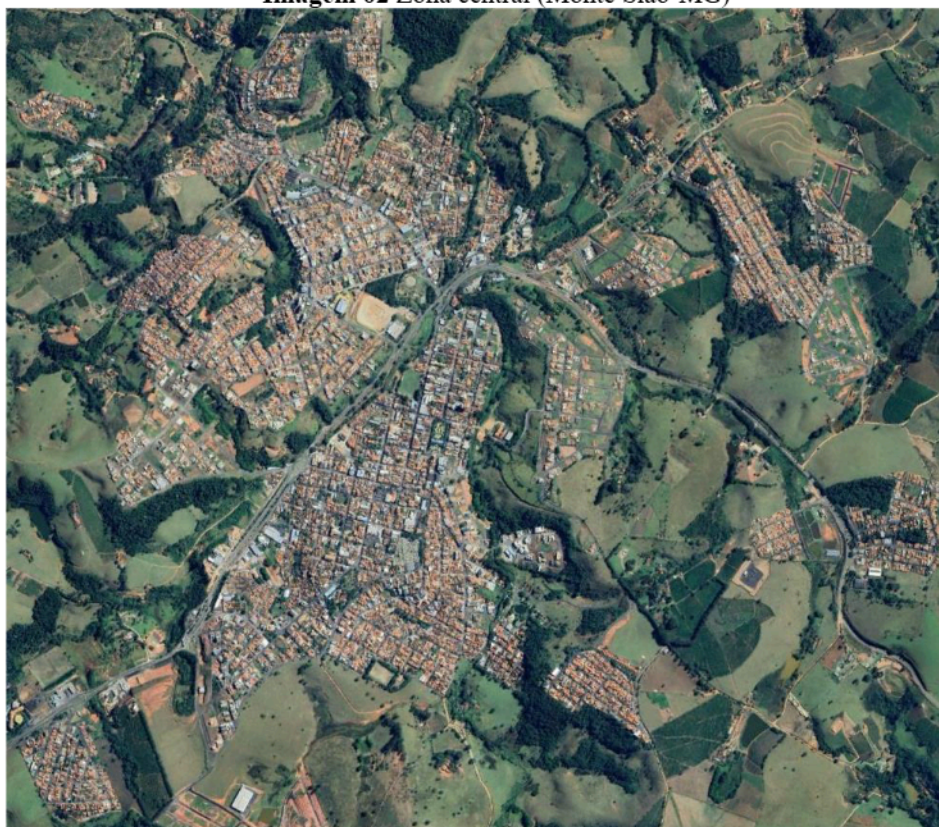
Imagem 02 Zona central (Monte Siao-MG)

Rua Maurício Zucato, 111 – Centro, Monte Siao/MG. CEP 37580-000 Telefone (35) 3465-4600 – e-mail: nucleocompras@montesiao.mg.gov.br